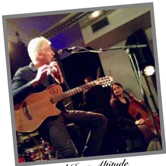
Festival Jazz Altitude