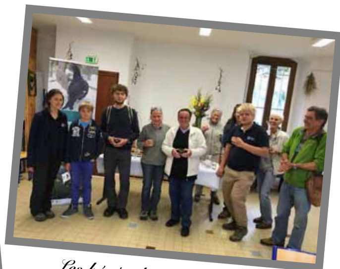
Les bénévoles de la bibliothèque au complet pour le goûter de la biodiversité avec la LPO