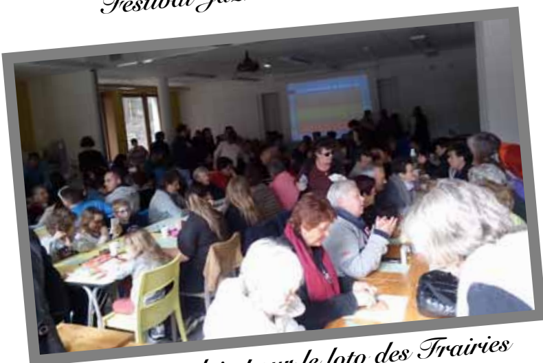
Carton plein pour le loto des Frairies