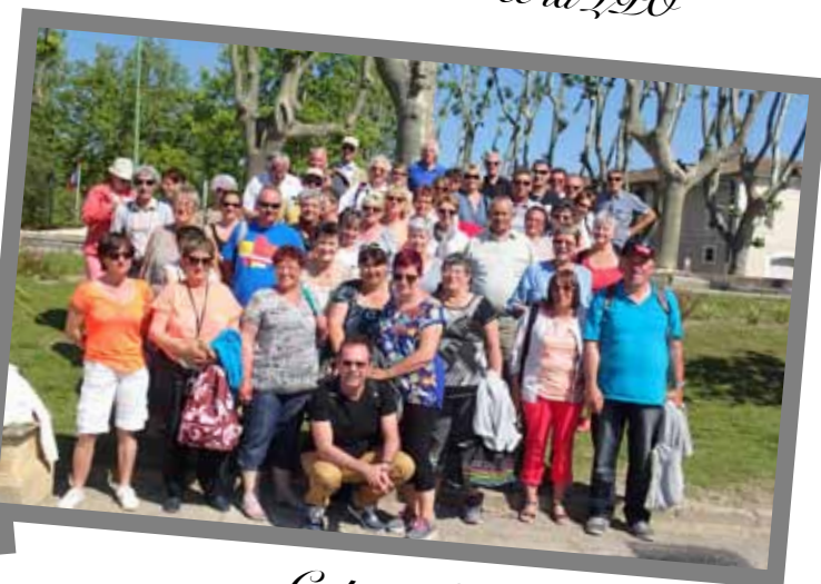
Cap au Sud : le voyage du comité des fêtes.