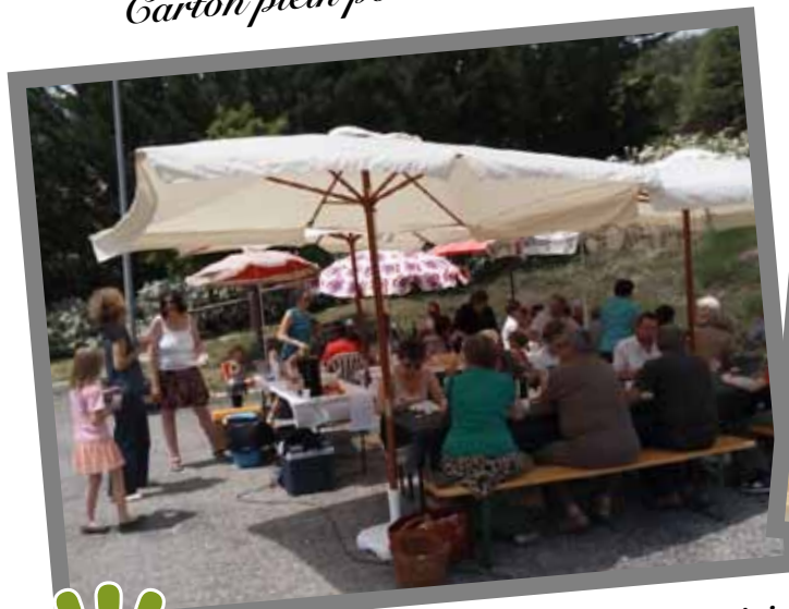
La traditionnelle fête des voisins