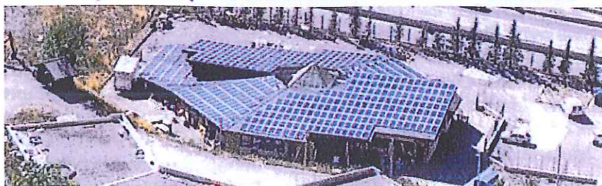
Toiture photovoltaïque de la Ressourcerie La Miraille à Saint Martin.