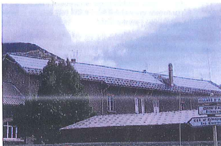
Toiture photovoltaïque de l'école de Pont de Cervières à Briançon.

** Coûts d'installation et de raccordement au réseau